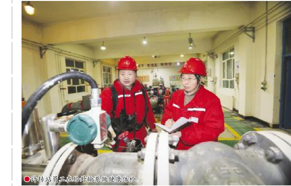
●巡检站员工在给外输泵做健康体检。

震后排查隐患 保障油气生产安全 1月23日02时09分,新疆阿克苏地区乌什县发生7.1级地震,河南油田新疆油气服务项目部迅速反应,启动应急预案,组织员工对油气集输站库、管线和油水井等进行全面隐患排查,加密巡检频次,排查异常,确保原油生产安全平稳运行。截至目前,该项目部服务的站库、油井均生产平稳运行。