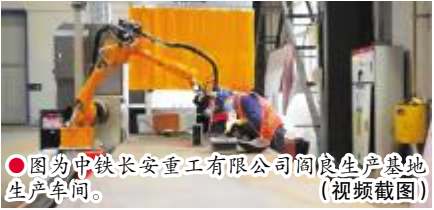
● 图为中铁长安重工有限公司阎良生产基地生产车间。(视频截图)

大力发展绿色产业,培育壮大绿色的新动能是加快发展方式绿色转型的重要途径。赵辰昕表示,下一步,将会加大政策引导和推动力度,持续加大对绿色产业的支持,推动绿色产业持续健康更好地发展。(据新华网)