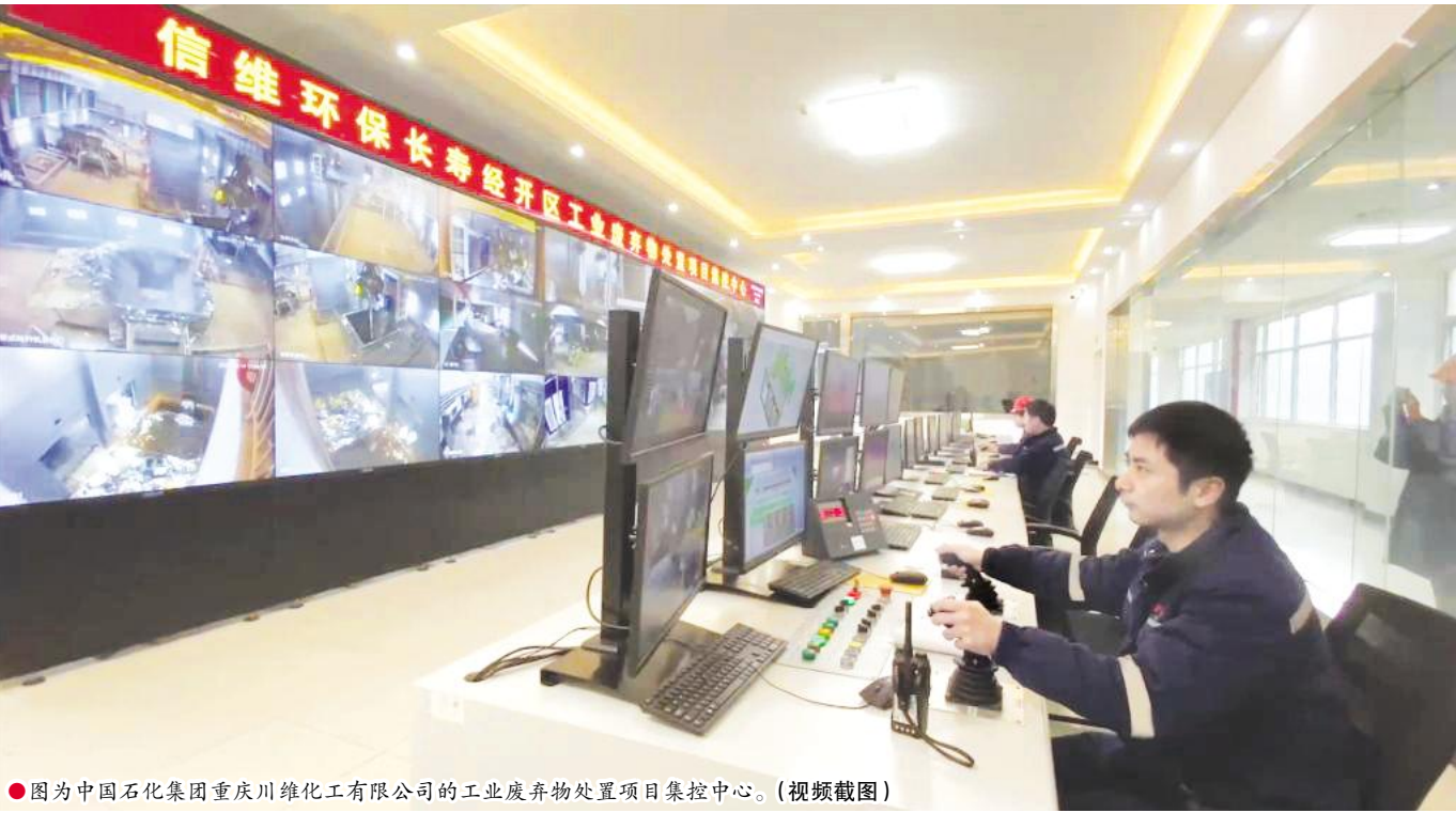
● 图为中国石化集团重庆川维化工有限公司的工业废弃物处置项目集控中心。(视频截图)