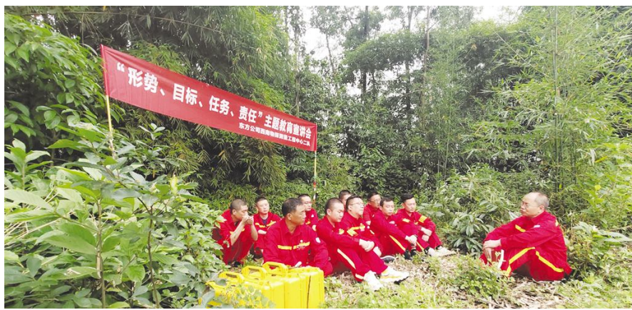
●工地主题宣讲现场

化战略），打造探区‘四个基地’（将西南探区打造成为公司国内创收创效规模基地、技术创新试验基地、人才队伍培养基地、基层党建示范基地），力争‘八个世界一流’（一流的业绩、一流的技术、一流的产品、一流的服务、一流的管理、一流的队伍、一流的文化、一流的品种），切实提升企业竞争力、创新力、影响力、控制力和抗风险能力，创建山地物探领域世界一流标杆企业，努力在公司率先打造世界一流进程中，站排头、做先锋，这是企业‘十四五’的发展目标。”