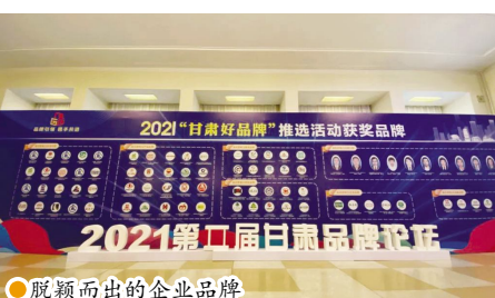
●脱颖而出的企业品牌

安多集团公司的“安多牧场”品牌获得“最具影响力甘味品牌奖”荣誉,这是对安多集团始终把品牌建设、产品品质和美味口感放在重要位置等方面给予的充分认可。