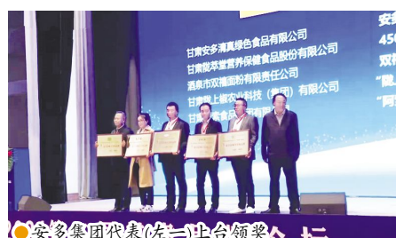
●安多集团代表(左一)上台领奖

5月15日上午,在由甘肃省委宣传部、甘肃省发展和改革委员会、甘肃省工业和信息化厅、甘肃省商务厅、甘肃省农业农村厅、甘肃省市场监督管理局等单位指导,甘肃日报社和甘肃省质量协会主办的2021第二届甘肃品牌论坛上,颁发了最具影响力品牌人物奖、最具影响力甘味品牌奖等多项奖项,甘肃