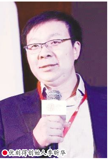
优刻得创始人李昕华