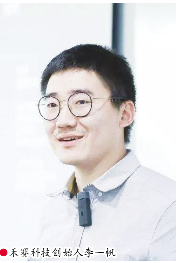
禾赛科技创始人李一帆