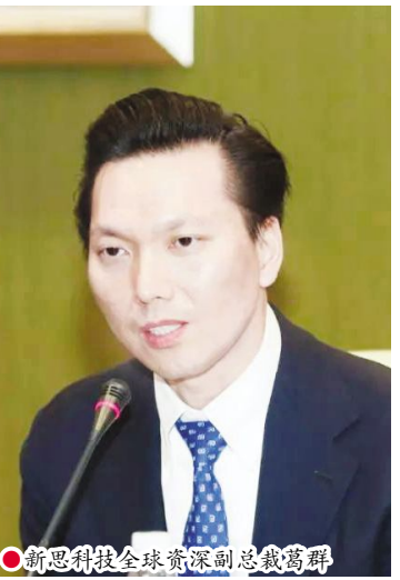
新思科技全球资深副总裁高群