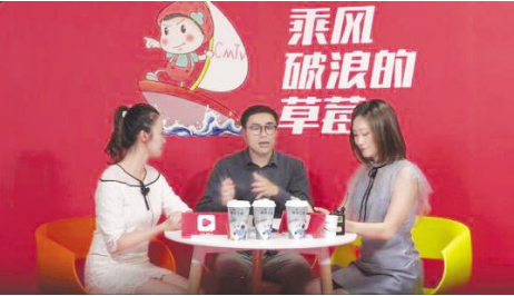
● 6 月 23 日，家电业内首个自主短视频及直播平台——草莓台正式开播。