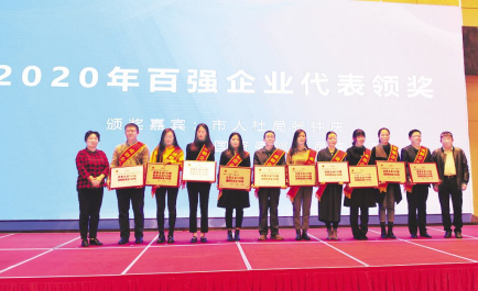
● 为 2020 年成都百强企业授牌