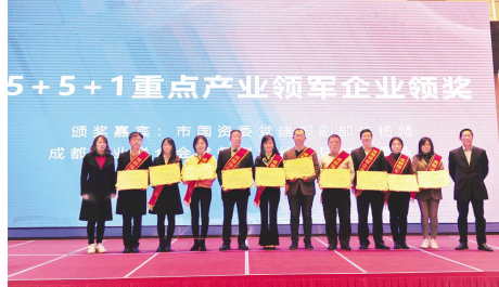
● 为 5+5+1 重点产业领军企业授牌