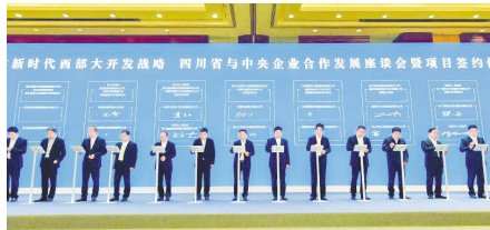
● 11 月 17 日，四川省与中央企业合作发展座谈会暨项目签约仪式在成都举行。