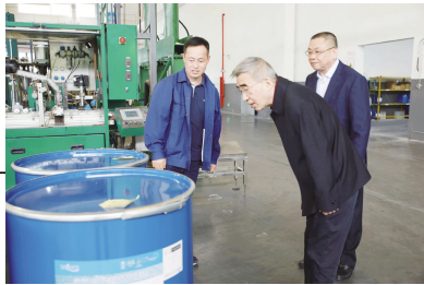
●领导在临基地考察