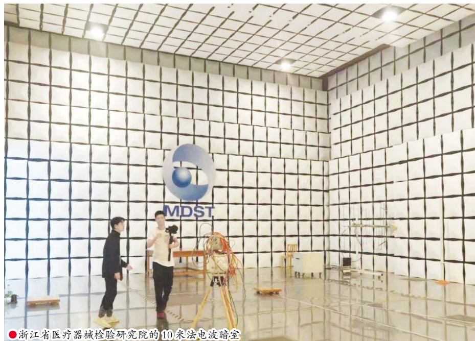
●浙江省医疗器械检验研究院的 10 米法电波暗室