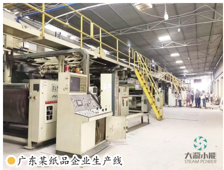
广东某纸品企业生产线

该工厂是包装行业的瓦楞纸板的一家民营生产企业,工厂的两条生产线原使用3+2吨传统锅炉加热,在实际的生产过程中,很多生产线加热是无法按需分配,蒸汽温度不能