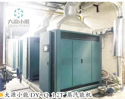
大源小能DY-Q 1.2T蒸汽能机

此次助力瓦楞纸板生产线智能升级,无疑是大源小能蒸汽能又交出了一份亮眼的成绩单,并为纸箱厂行业打开一方节能环保的新天地。