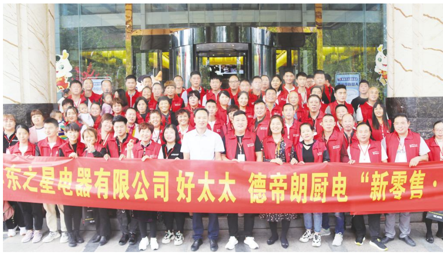
华东之星电器有限公司好太太德帝朗厨电“新零售”

郑州华东之星电器有限公司成立于2009年,位于郑州市管城区郑汴路89号3区B208号。经过多年的发展,公司一直以来坚持品质第一、优质服务,与时俱进、共赢发