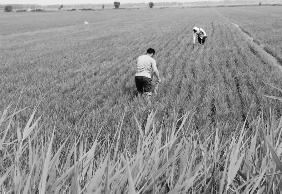
合作社技术员在水稻基地指导农户田间管理

辽宁北方戴纳索公司所用原料为苯乙烯和丁二烯,而这些原料都是华锦集团的产品。“经过生产转化,苯乙烯和丁二烯最终变成高端的丁苯橡胶,用于高性能轮胎和沥青改性等领域。类似企业互相吃配,循环利用的例子,在园区还有很多。”戴纳索公司技术人员