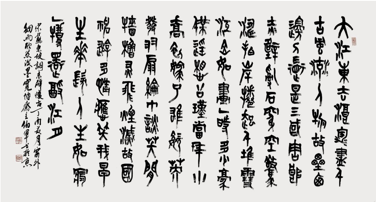
大篆作品 苏东坡词《赤壁怀古》180×98cm

《宋伯军艺术作品集》由人民美术出版社出版发行,撰写的总共五十二集的大型系列讲座《快乐书法》,由著名书法家田伯平主讲,已于2016年在中国教育电视台和兵团卫视滚动播出,并制作成光盘出版发行,受到了广大观众的好评。