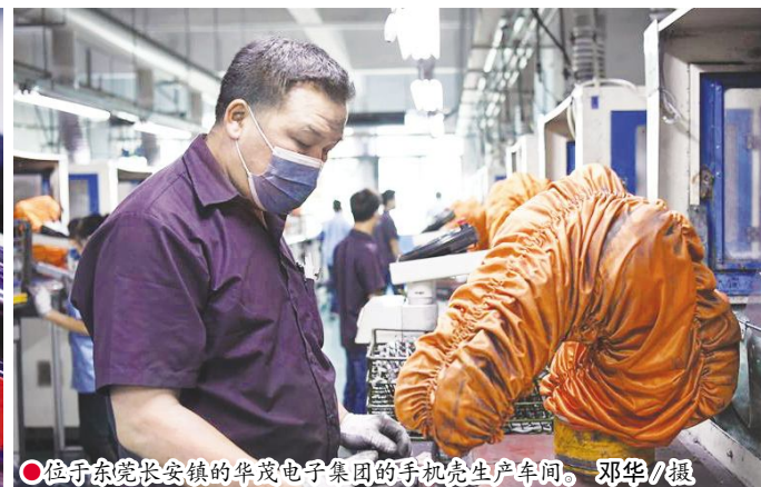
位于东莞长安镇的华茂电子集团的手机壳生产车间。