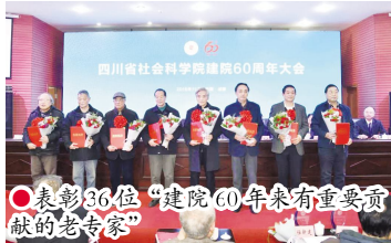
表彰36位“建院60年来有重要贡献的老专家”