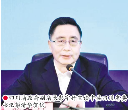
四川省政府副省长彭宇行宣读中共四川省委书记彭清华贺信