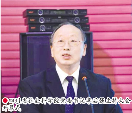
四川省社会科学院党委书记李后强主持大会开幕式