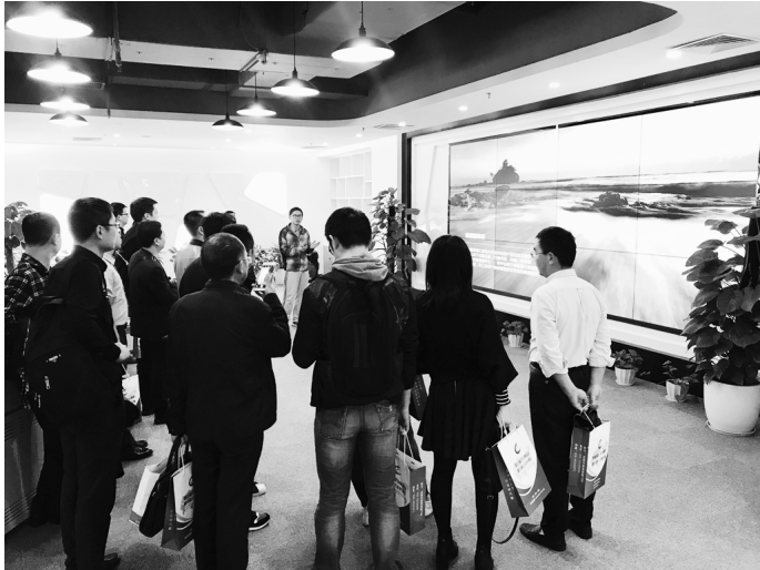
●培训班学员参观智慧企业数据及云服务中心

为了让参加培训的企业既学到智慧企业建设的理论知识,又可以现场参观大渡河公司智慧企业建设成果,理论结合实际,以达到更好的培训效果。今后我们还将根据企业需求有针对性的适时举办此类培训班,努力为促进企业管理创新、转型升级、实现高质量发展做出应有的贡献。