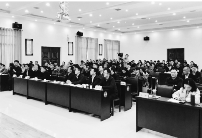
●首期“南部精英大讲堂”现场

济,毫不动摇地鼓励、支持、引导、保护民营企业发展。我们要为民营企业营造好的法治环境,进一步优化营商环境。党的路线方针政策是有益于、有利于民营企业发展的。民营企业也要进一步弘扬企业家精神、工匠精神,