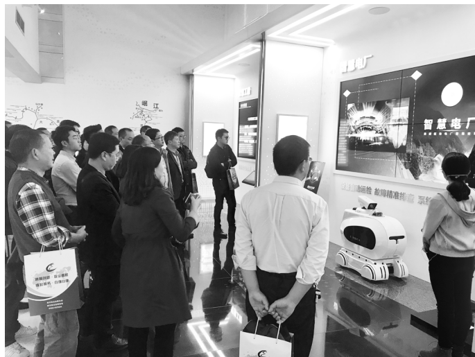
●培训班学员参观智慧企业展厅