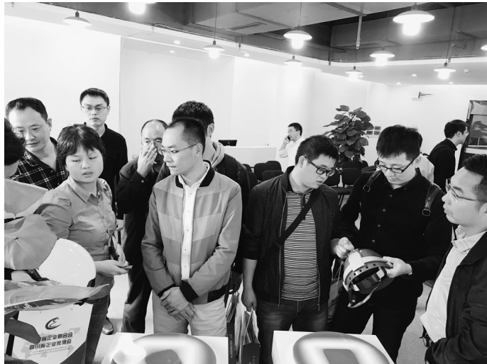
●培训班学员参观智慧企业研发中心