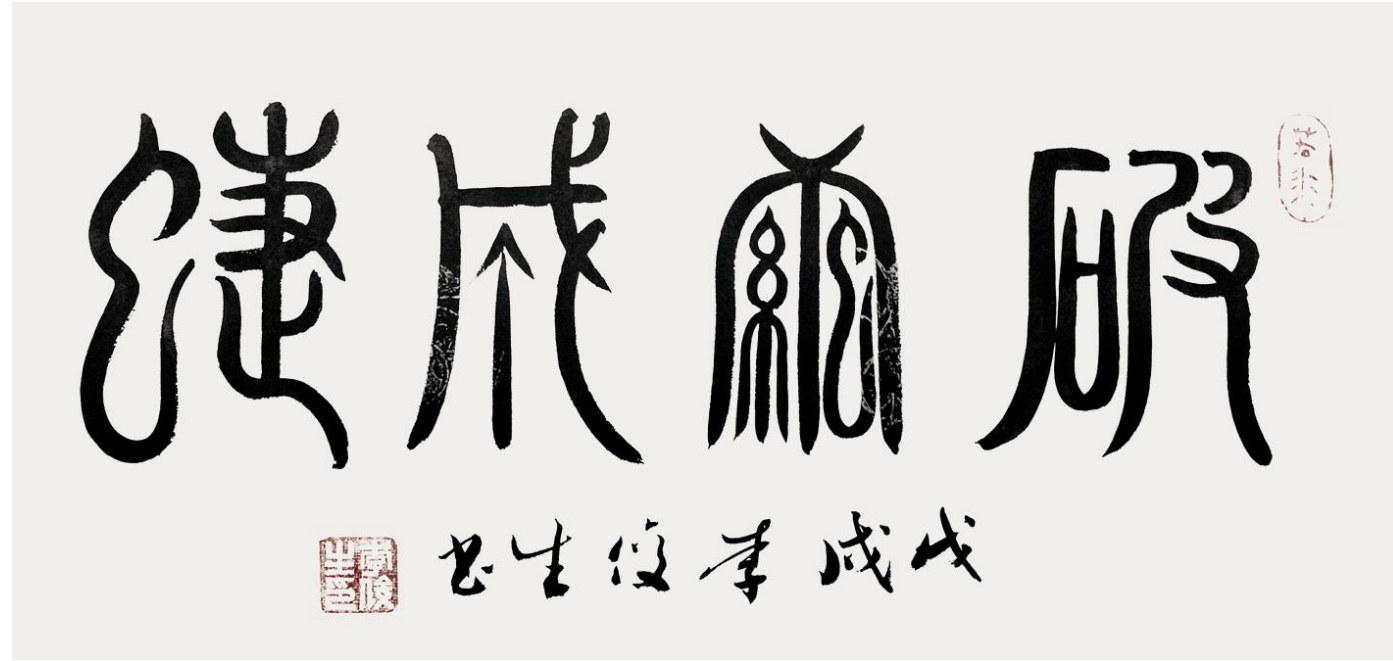
李俊生作品《破茧成蝶》规格:40cm×30cm

畅通达,笔力藏于笔画之中,使气息浩然、绵绵然而首尾贯通。李俊生擅写“福”,他写的《千福图》就曾受到一致好评,一幅作品里的每个“福”都有着不同的写法,不一而足,且每个字都极尽用心,从不苟且。也能从中感受到他是一位淡泊名利,为他人送祝福的艺术家!