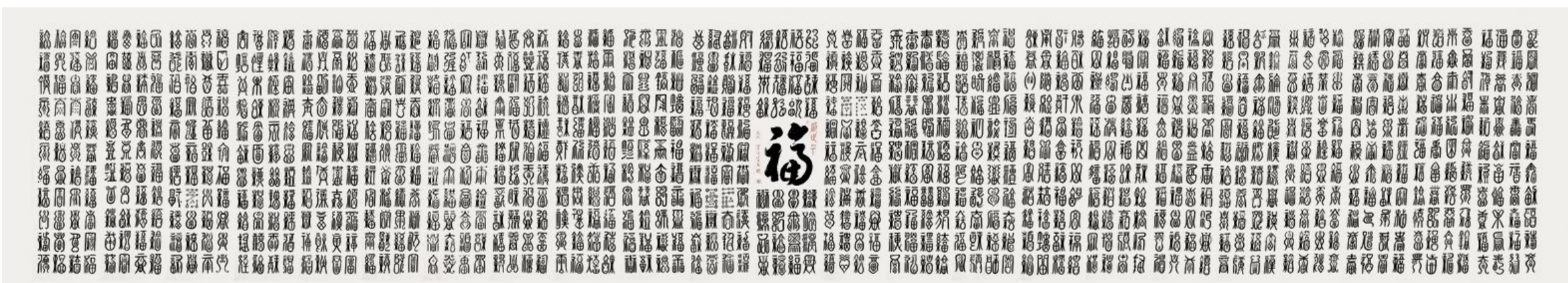
李俊生作品《盛世千福》规格:1200cm×180cm