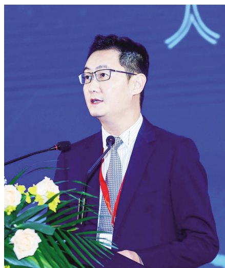
腾讯董事会主席兼首席执行官马化腾

10月24日,2018中国(广州)新一代人工智能发展战略国际研讨会暨高峰论坛揭幕,腾讯董事会主席兼首席执行官马化腾在演讲中分享了他对人工智能发展的最新思考和感受。他表示:“人工智能的生命力在于实践应用,实践是检验人工智能技术的重要标准。”比如在医疗场景,去年腾讯首个医疗AI产品“腾讯觅影”投入使用,利用AI医学影像分析辅助医生进行食管癌、