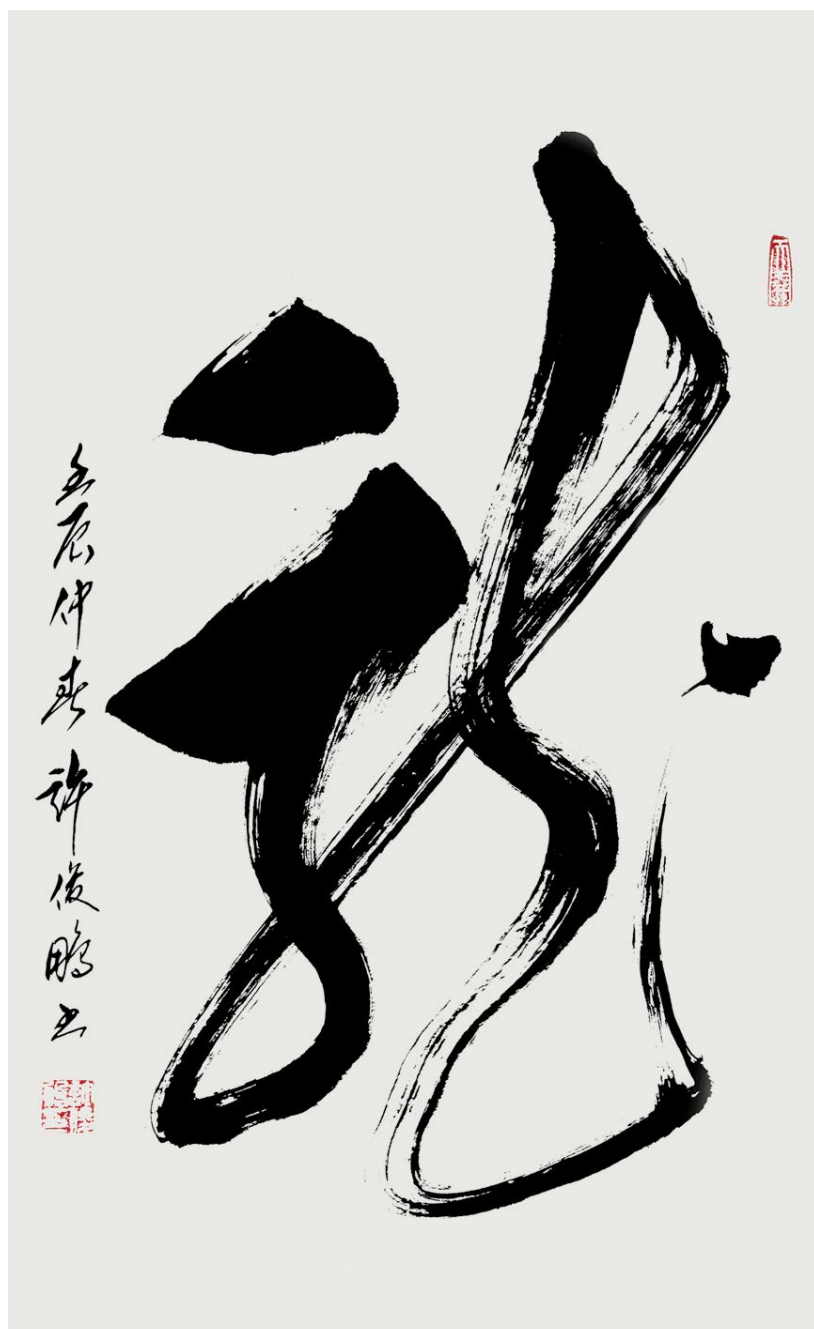
《龙》草书直轴 规格:70cm×48cm 2012年创作