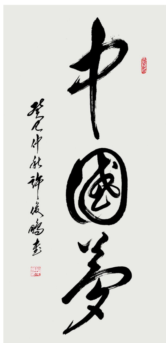
《中国梦》草书中堂 规格138cm×70cm 2013年创作