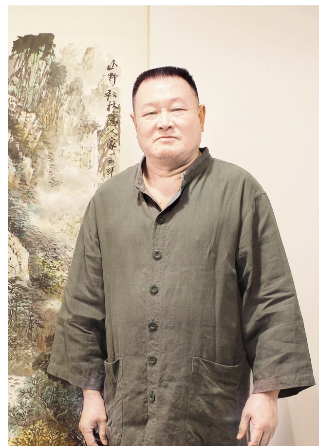
中国书画名家唐必林作品鉴赏