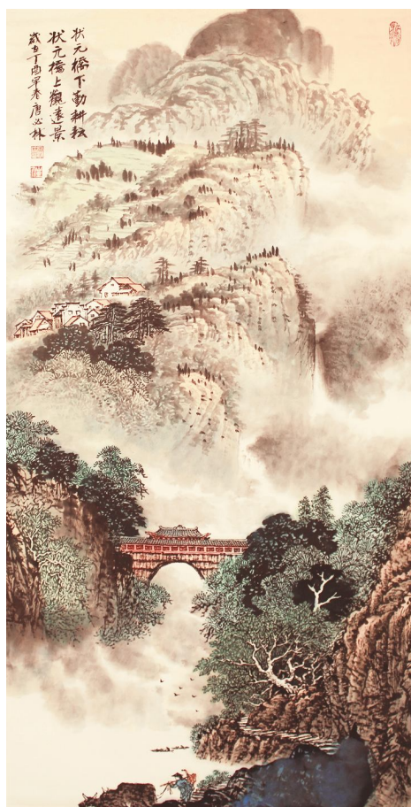
《状元桥下勤耕耘 状元桥上观远景》