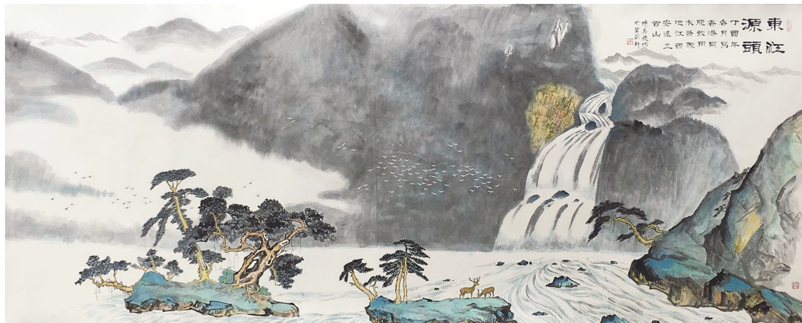
陈其旋作品《东江源头》巨幅山水画,是江西安远三百山,是供应香港七百万同胞饮用水源头,香港市民称为生命之水。规格:425cm×169cm

1963年在西安美术学院国画系本科毕业,系中国国务院外事礼宾形象大使、国宾礼特供艺术家。现任世界艺术家联合会会长、大爱基金会主席。新世纪以来,在世界各地举办了十届“世界华人艺术精品大展”。2004年荣获亚洲最高荣誉“亚细亚美术赏”大奖。2012年入编“当代最具世界影响力的八大艺术巨匠”一书。2014年率中国艺术家代表团赴法国卢浮宫举办“中华艺术精品展”。其作品被洛杉矶博物馆、北京人民大会堂、墨西哥政府画廊收藏。他将国画界奉为金科玉律的南齐国画大师谢赫的“六法论”改写,倡导了“新六法论”。他还独创了中国“兰体书法”。陈其旋是在国际上享有盛誉的中国书画艺术大家。