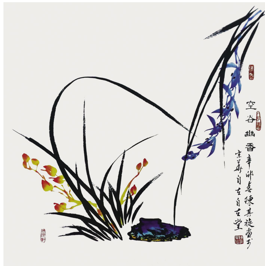
陈其旋作品《空谷幽香》规格:68cm×68cm

他的写意作品空灵,章法绝妙,尤其是对花草画中的兰花的表现形式非常独特,再配上陈其旋先生自创的中国“兰体书法”,整个作品达到一种完美的境界,内涵深远的同时凸显自己最独到的见解和艺术气息。在当今书法美术界中,陈其旋先生的作品在继承古人古法的基础上发扬了自己的风格和特征,在艺术传承与发展中体现了一位中国艺术家应有的努力与情怀!