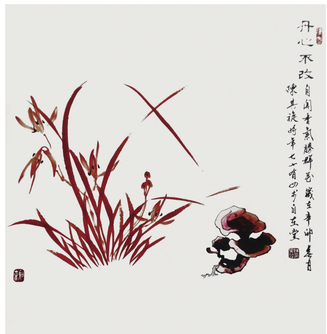
陈其旋作品《紫气东来》规格:68cm×68cm