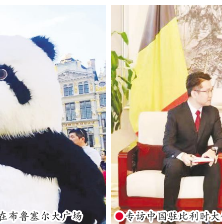
专访中国驻比利时大使馆经商参赞郭建军(右)

郭建军告诉记者,五年来,中资企业在比利时获得很大的发展,主要以投资并购为主。吉利集团收购了沃尔沃根特汽车厂,成为年产值 26 万辆的比利时第一大汽车制造企业,