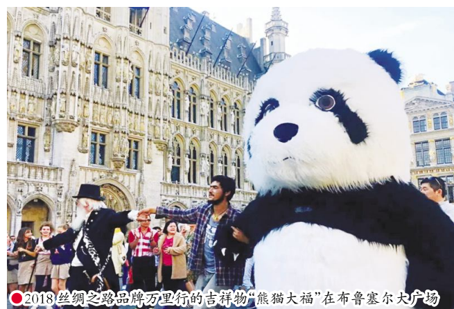
2018 丝绸之路品牌万里行的吉祥物“熊猫大福”在布鲁塞尔大广场