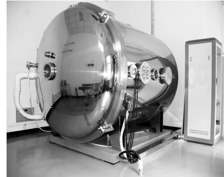
●图为真空环境模拟装置

日前,航天科工 203 所将其航天器组件热真空环境模拟装置进行开放共享。此前该装置主要应用于 203 所星上型号辐射计上星前热真空环境定标试验,为了最大限度体现其应用价值,也最大限度地满足有相同需求的单位,203 所决定将该试验装置开放共享。