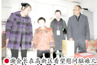
●谢会长在高新区看望慰问脑瘫儿