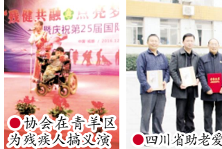
●协会在青羊区为残疾人搞义演