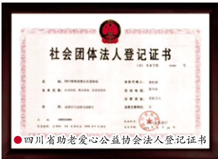
●四川省助老爱心公益协会法人登记证书

一些公益性的服务工作。对单身和空巢老人特别关爱，创造条件搭建平台，牵线搭桥，两年中让数十对单身老人晚年喜结良缘，找到了相爱的幸福老伴。