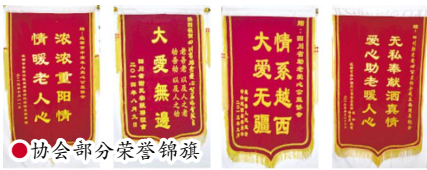
●协会部分荣誉锦旗

他采取分片区设立助老爱心活动中心，在老年人中物色热心公益活动的志愿者，专人负责，定期开展公益慈善帮扶和各种文化娱乐活动。以协会直属爱乐艺术团为核心组织老年文艺表演，举办健康养生讲座，开展健康服务咨询，组织老年人参加各种类型生态旅游；秉承中华“孝行天下”传统文化，特别推出了“四川省助老爱心服务中心”，一月活动两次以上。对50至75岁的健康老人做