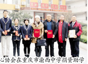
●四川省助老爱心协会在重庆市渝西中学捐资助学