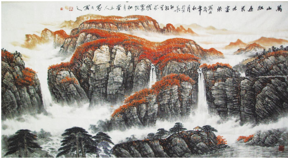
《万山红遍丛林尽染》

量书刊、杂志、楼寓、殿堂的题字。现为文化部中国化管理协会理事、书画专业委员会委员、中国将军诗书画院创作员、中央国礼艺术研究院解放军长岭书画院院长、中国山水艺术创作院副院长、国家一级美术师、全国科技文委高级专家、毛泽东书法研究会理事、世界书画艺术家联盟委员、钓鱼台特聘画家、中华人民共和国大典编修指导委员会委员、艺术编委等职。