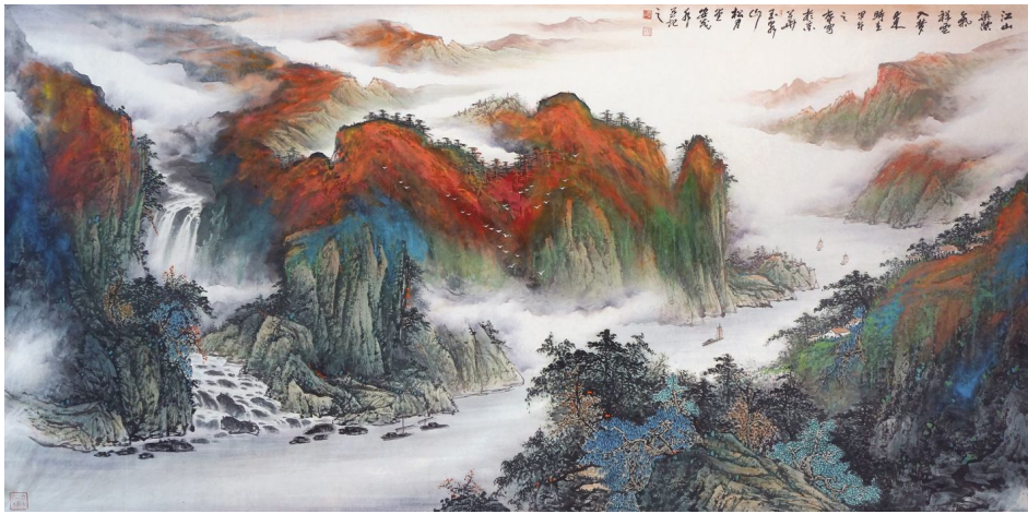
《江山染紫气祥云入梦来》