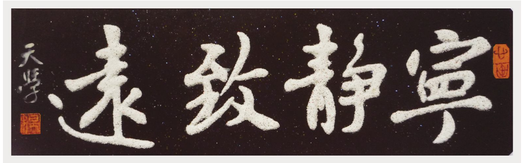
《宁静致远》尺寸: 166cm×42cm 2016年创作