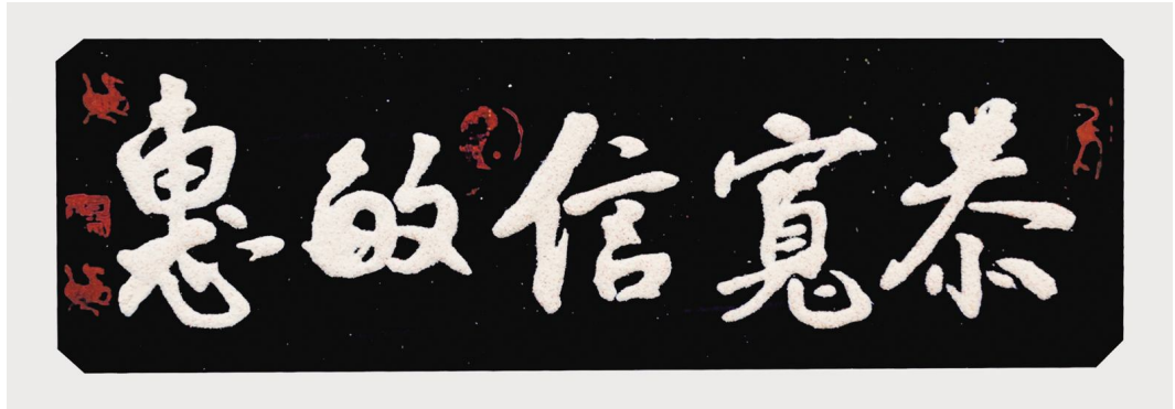
《恭宽信敏惠》尺寸: 178cm×42cm 2015年创作