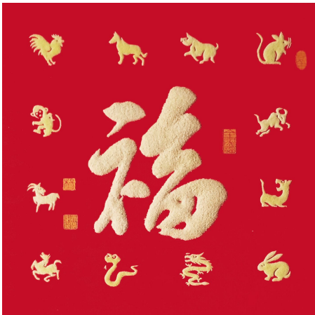
《全家福》尺寸: 60cm×60cm 2015年创作

经近五年的探索创研,彩色砂石系列书法作品已成功走向市场,彩色砂石书法是家庭客厅、书房,办公室、会议室等场所理想的装饰艺术品,也是馈赠亲友的高级礼品。