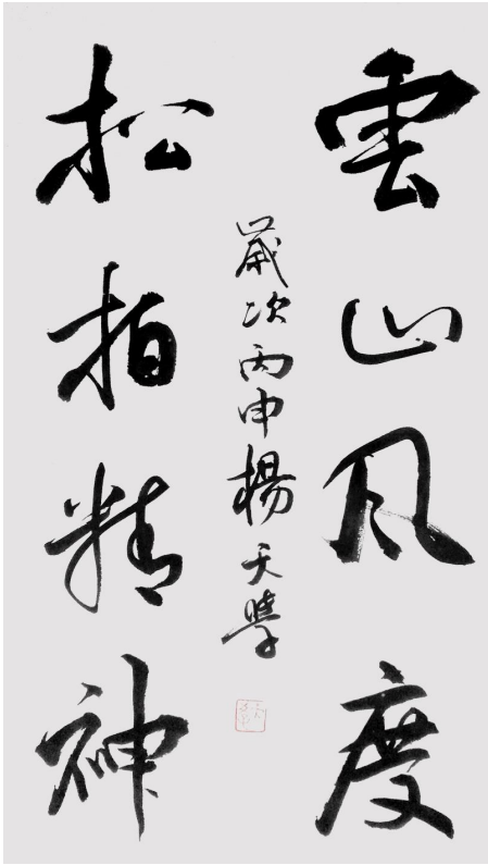
《云山风度 松柏精神》