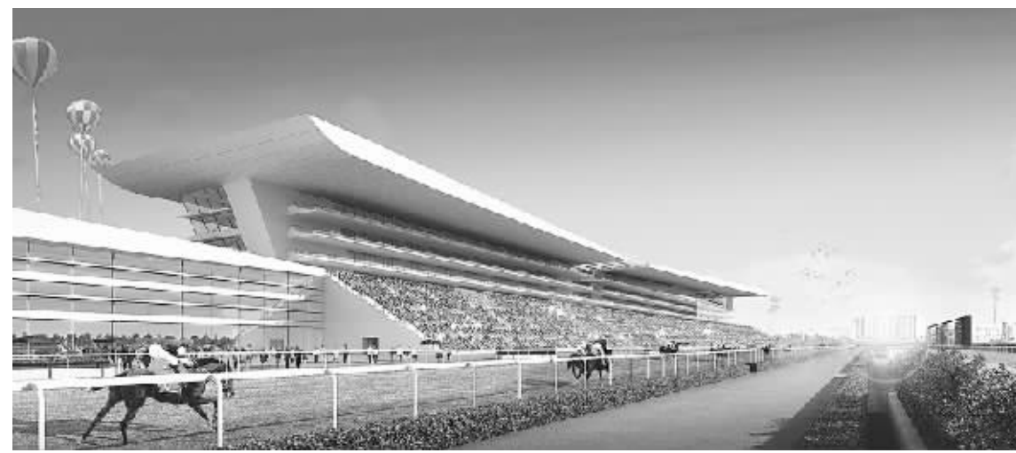
● 西部自驾游枢纽项目马术体育公园赛场效果图