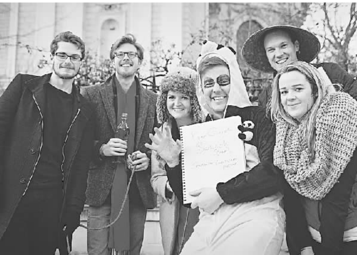
● 欧洲民众热情参与“行南丝绸之路,游大熊猫家乡——欧洲熊猫粉丝四川探亲之旅”活动

2013年来,我国提出建设“丝绸之路经济带”和“21世纪海上丝绸之路”的战略构想,为四川省旅游业发展带来了新机遇。丝绸之路不仅是通往亚欧北部的商路,更是一条充满丰富自然资源和人文情怀的旅游线路。2015年,国家旅游局把全年旅游主题确定为“美丽中国——丝绸之路旅游年”,将进一步加大与丝绸之路沿线国家文化旅游交流合作,不断提升丝绸之路旅游文化品牌的国际影响力。