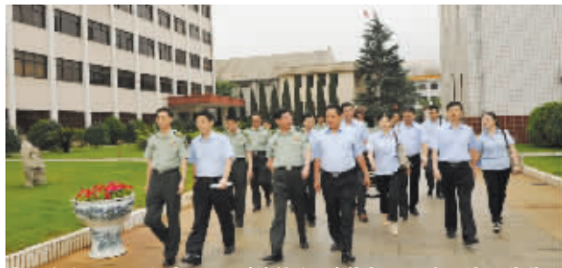
◎云南省军区司令部副司令员邱型柏(前排左三)等部队领导热情接待茅台酒股份有限公司副总经理杜光义(前排右一)、茅台集团纪委常务副书记罗国庆(前排左二)一行。