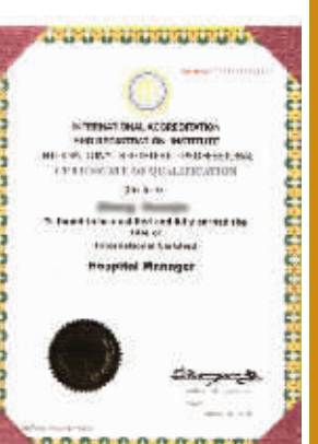
硕博学位在全球国际认证与注册协会的认证