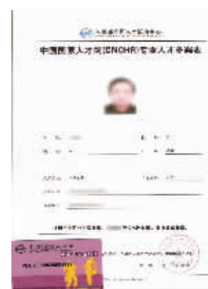
硕博学位在中国国家高级管理人才的认证