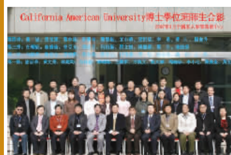
CAU 毕业学员与中国有关部委领导和专家合影