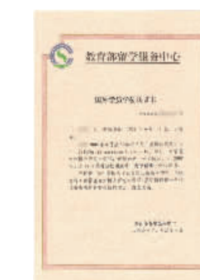
留学硕博学位在中国教育部相关机构的认证