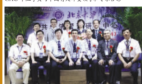
优秀学员被评为北京大学或中国教育研究会研究员