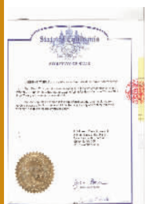
硕博学位在美国相关政府的认证