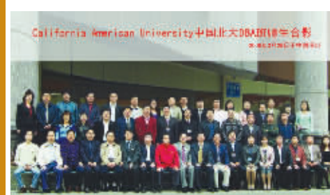
国务院学位评委会和国家人保部等专家出席 CAU 开学典礼