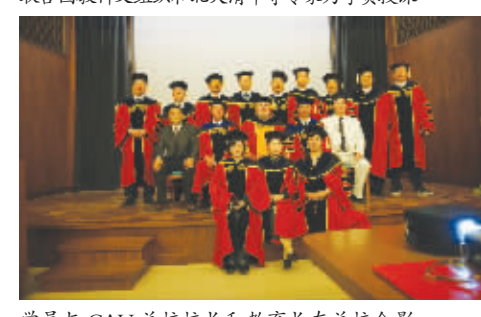
学员与 CAU 总校校长和教育长在总校合影