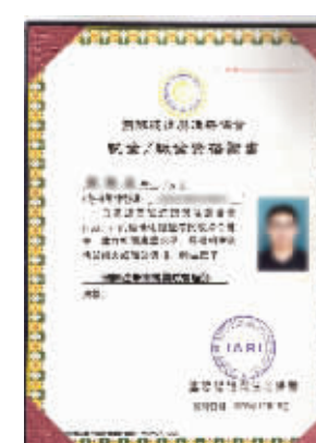
硕博学位在中国教育部相关机构的认证