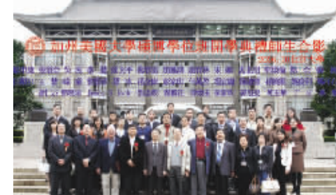
CAU 总校教育长与学员在中国合影