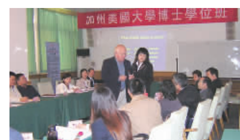
联合国教科文组织和北大清华等专家为学员授课

California American University(也称“加州美国大学或加利福尼亚美洲大学”)是美国教育文化基金会(U.S. Education & Culture Foundation)直属正规大学(美国加州州政府教育部 www.bppve.ca.gov. 美国联邦政府移民局 www.ice.gov. 大学 www.calamuniv.edu),总校位于美国加州洛杉矶阿罕布布拉市,校园环境舒适优美,现有二千多名在校生及数百名毕业于全球名校的博士级教授。学员以美籍为主且大都是工商界的高级主管与精英,还有中国大陆及港澳台和全球数十个国家的国际学员,其中不少学员已在本国政府身居要职或担任工商及金融高级主管。