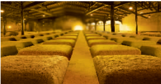
剑南春“天益老号”古窖池群