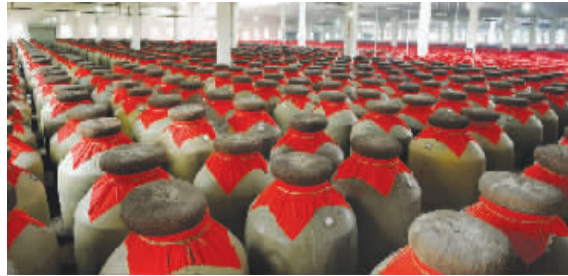
剑南春万吨陶坛库