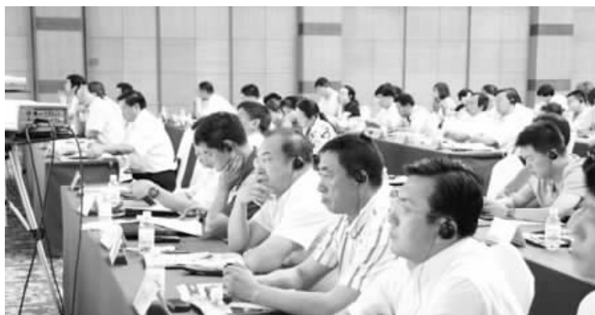
与会企业代表在认真听非洲投资政策

鉴于目前国内房地产市场的特殊情形,青岛不少建筑企业有去非洲发展房地产的意向。除了建筑业外,制药业和加工制造业等行业的一些企业也摩拳擦掌,准备大举进军南非市场。