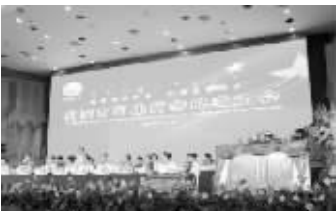
内蒙古湖北商会成立大会于7月15日隆重举行