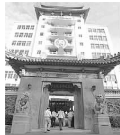
新加坡中华总商会大会

由新加坡中华总商会倡导的第一届世界华商大会1991年在新加坡举行,之后每两年在不同的国家和地区举办。2011年,世界华商大会将再次在新加坡举行。张松声说:“这是一个20年的轮回,在20年间,华商在世界的影响力已经大大提升。我希望通过明年10月5日到7日在新加坡举行的第11届华商大会,聚集世界各地华商,重新规划我们华商在世界的发展。”