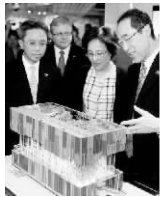
香港政务司司长唐英年(右一)

致的准备工作,人性化的行程安排,优秀的导游以及园区内精彩的展馆展示等都给会员们留下了深刻的印象。