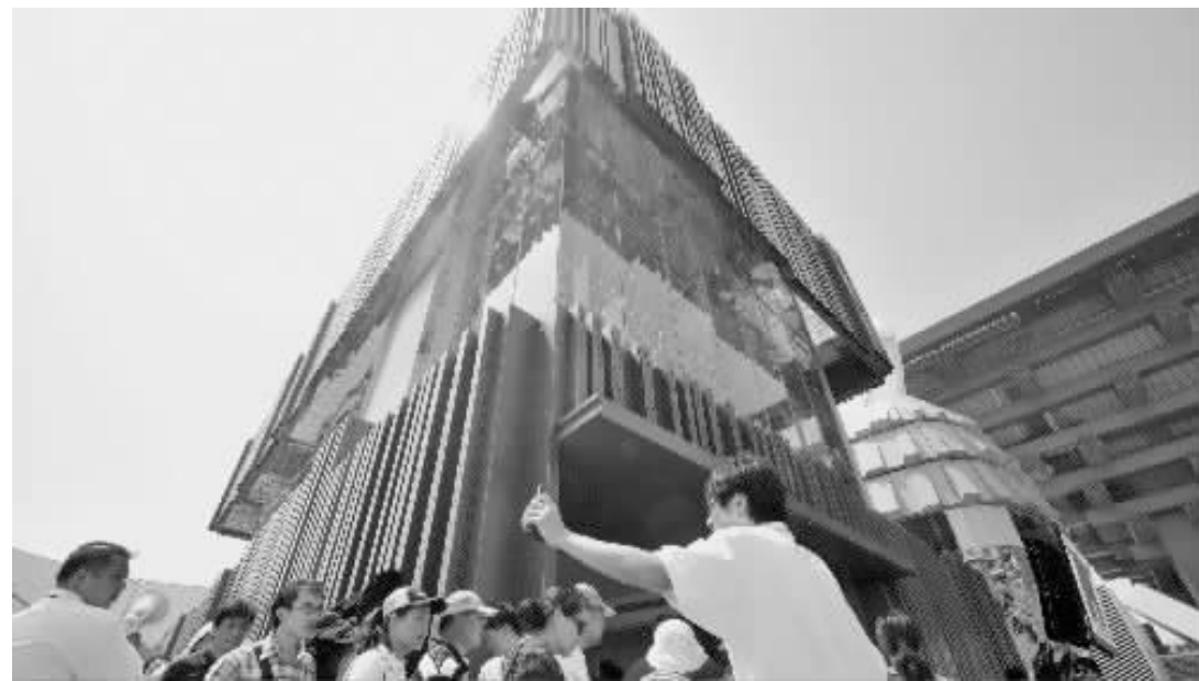
上海世博会开园迎客当天,香港馆前排起人龙