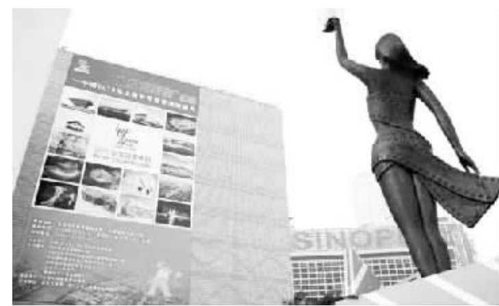
上海世博会宣传海报与香港金像女神雕像交相辉映

如果购买过本届世博会的消费卡,你就会发现,除了可以消费,还有另外一项保险业务赠送,这就是“神赐保险”。它的保险项目涉及游客的人生、财产安全及突发性医疗意外等,可以说是一份很贴心的人性化保险。