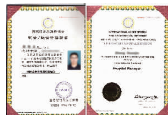
硕博学位在全球国际认证与注册协会的认证