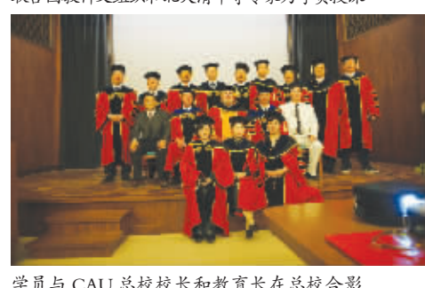
学员与 CAU 总校校长和教育长在总校合影