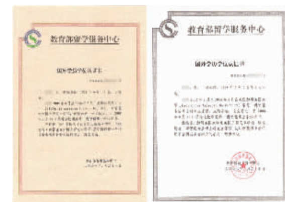
留学硕博学位在中国教育部相关机构的认证