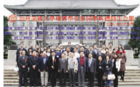
CAU 总校教育与学员在中国合影