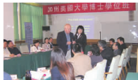
联合国教科文组织和北大清华等专家为学员授课