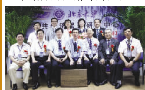
优秀学员被评为北京大学或中国教育研究会研究员