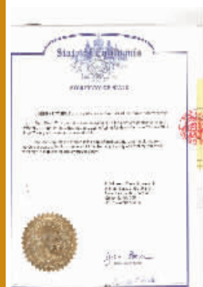
硕博学位在美国相关政府的认证