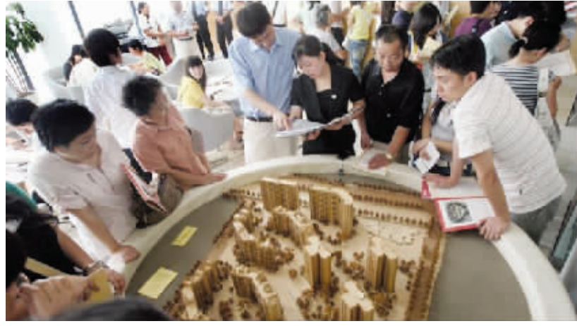
“干打雷不下雨”,万科楼盘降价是在打“太极”?

可是万科这次“干打雷不下雨”的做法很奇怪,说降价而没有明确的降价说明,似乎与其他房企一样,在等待某个时间节点。万科带领众多大型房地产