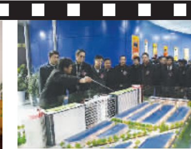
今年1月16日,参加四川源力光电有限公司LED一期项目投产仪式的各级领导及嘉宾参观公司展示大厅