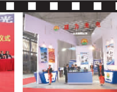
2010年初,四川源力光电成都会展现场