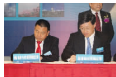
天府四川宝岛行经贸洽谈签约仪式

LED照明产品涵盖道路照明、办公照明、商务照明、工业照明、户外照明等多个领域。并与古龙集团旗下的不锈钢生产企业合作,推出不锈钢路灯杆和不锈钢灯具,实现LED照明器具的终身免维护。