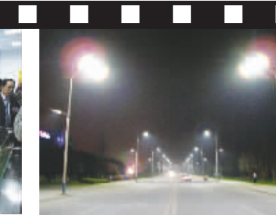
改造后的成都现代工业港港富路夜景实拍