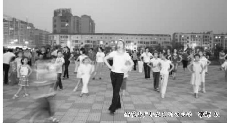
稻花香广场文艺活动启动

广场文艺活动由稻花香文艺宣传队组织,主要通过现场教学、集体舞蹈的形式,向龙泉镇居民和稻花香职工教授健身操、民族舞、交谊舞等舞蹈。广大职工和当地居民普遍认为,广场文艺活动不仅丰富了娱乐方