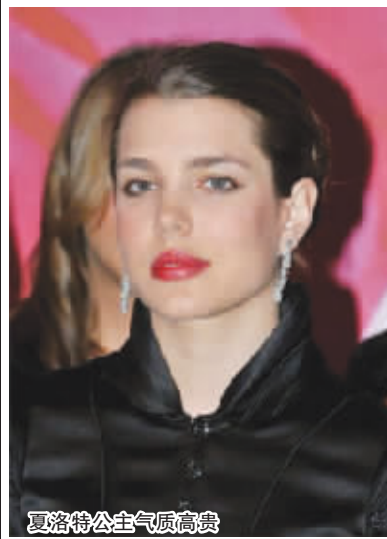
夏洛特公主气质高贵

英式马靴也有高筒型的,但对于初学者来说,短靴加护腿的形式更合适,不仅行走更方便,穿戴更舒适,而且性价比还高。