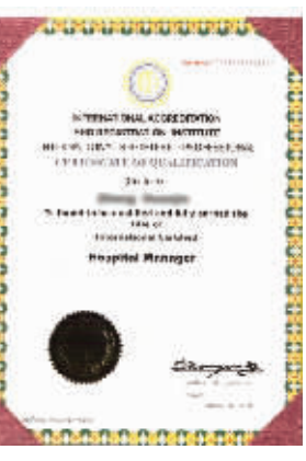
硕博学位在全球国际认证与注册协会的认证