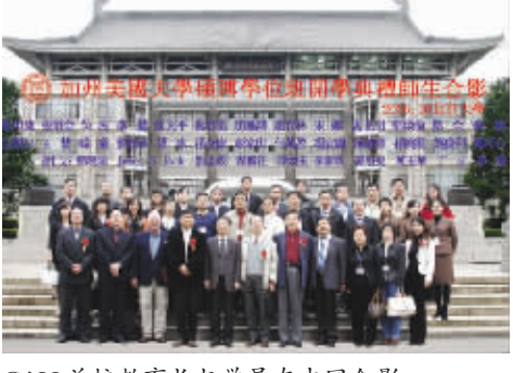
CAU 总校教育与学员在中国合影