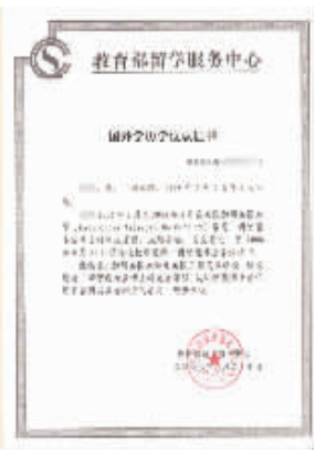
留学硕博学位在中国教育部相关机构的认证