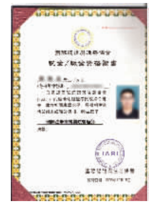
硕博学位在全球国际认证与注册协会的认证