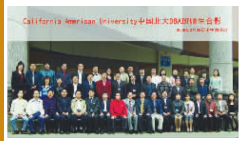
国务院学位评委会和国家人保部等专家出席 CAU 开学典礼