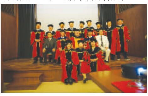
学员与 CAU 总校校长和教育长在总校合影