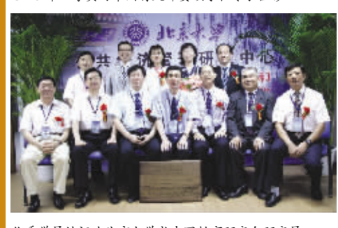
优秀学员被评为北京大学或中国教育研究会研究员

【CAU 硕士博士学位班 致力于凝聚中国中高层实力人士和管理精英】 中国教育研究会引进 California American University 工商管理硕士博士学位项目，旨在培养中国现代化建设和国际化发展所需的工商管理高级精英人才，并与北京大学、中国人民大学、首都经济贸易大学、东北大学、国家人事部(人保部)中国高级公务员培训中心、中国经理人联合会等的相关部门合作，并经四川、陕西、辽宁、湖南、山西、哈尔滨、佳木斯、安阳等省(市)的组织人事部门批准举办。该项目中国校友会已凝聚了数千名中高层人士和管理精英。