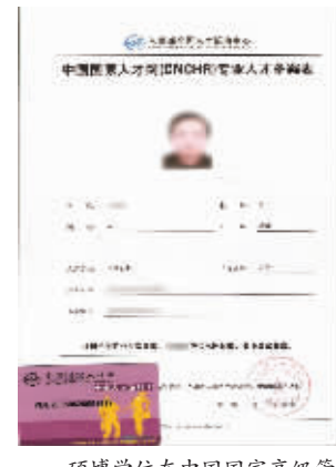
硕博学位在中国国家高级管理人才的认证