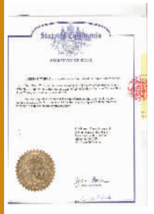
硕博学位在美国相关政府的认证