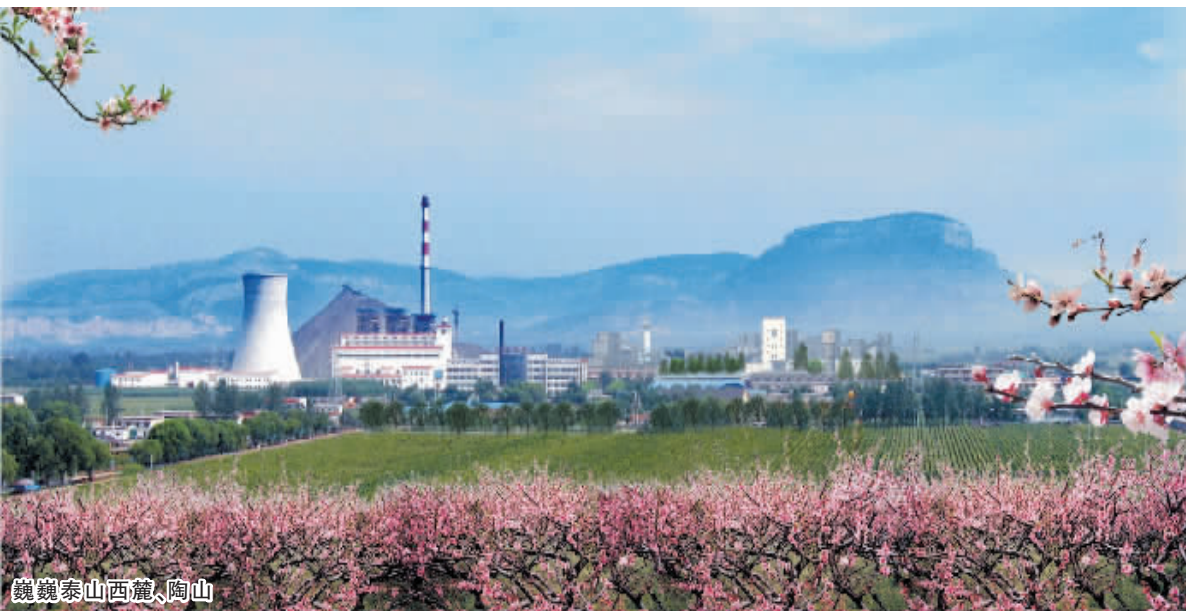
巍巍泰山西麓、陶山