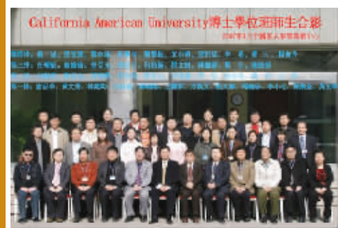
CAU 毕业学员与中国有关部委领导和专家合影