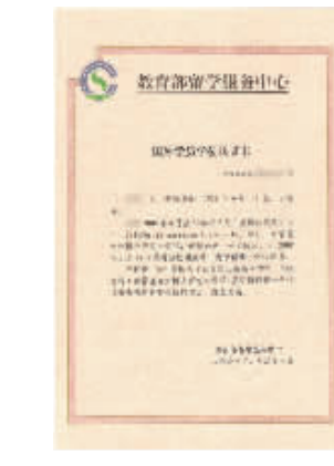
留学硕博学位在中国教育部相关机构的认证