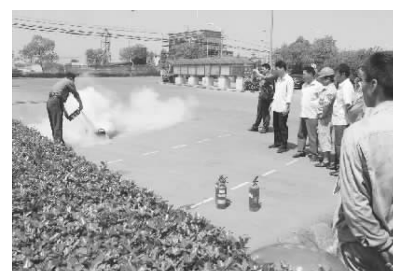
5月底，张家港市消防大队千警在张家港联合铜业有限公司举办了现场消防演习，以提高职工的防火意识，杜绝火灾事故的发生。公司近50余名兼职消防员都参加了演习。 图为兼职消防员在千警们讲述灭火器使用方法时进行现场操练。

质量管理在企业运营中的作用越来越突出，企业生存的基础是对市场的占有，是对客户的回报，而这些都和产品的质量密切相关，如何才能保证产品的质量，是每个企业考虑最多也是投入精力最大的问题。优质的产品要有优质的原材料为前提，精良的设备为基础，先进的工艺为条件，及时的市场服务为保障，才能最终确保产品的质量，质量管理贯穿于整个产品的生产过程。正昌作为有90余年历史的企业，始终将提高产品质量作为企业实现发展的基础，至此，正昌集团全系列主机产品及成套工程通过了欧洲CE认证和俄罗斯GOST认证，受到欧美客户的一致好评；2010年，正昌集团又荣获“全国质量信得过企业”、“全国AAA级诚信单位”等荣誉称号。在现代企业的管理过程中，正昌是如何践行对客户的质量承诺呢？