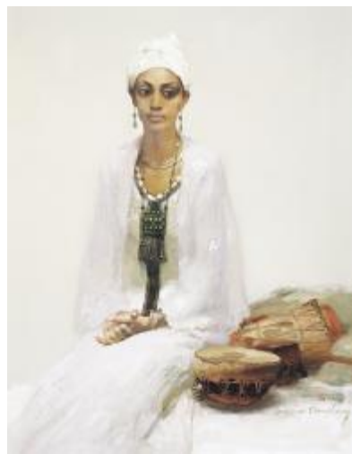
《埃塞俄比亚少女阿贝贝》2007年 130×100cm 国内私人藏 布面油画