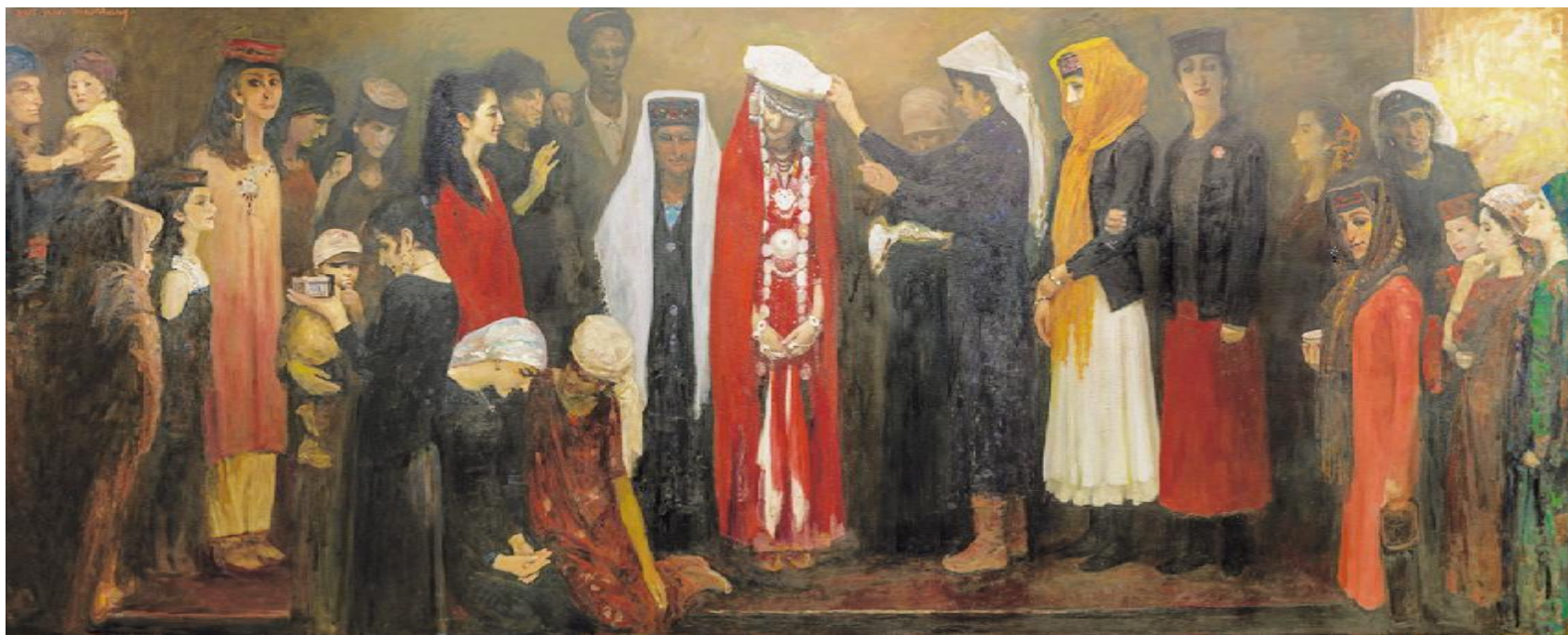
《塔吉克闺房里的新嫁娘》2018-2019年 200×500cm 布面油画 中国国家画院收藏