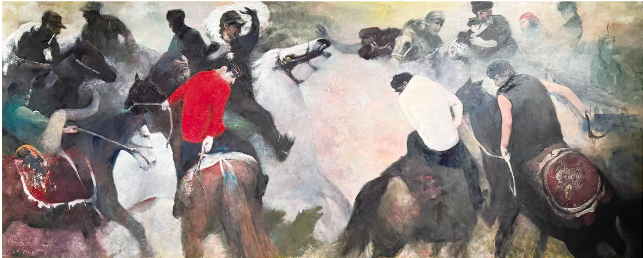
《塔吉克人的大叼羊》200×500cm