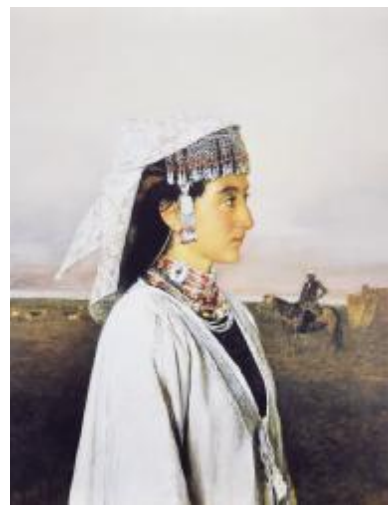
《在那遥远的地方》1995年 75×60cm 布面油画 民生银行收藏