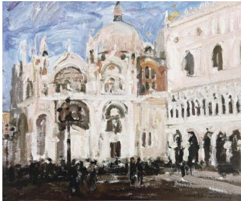
《威尼斯广场》布面油画 38cm×46cm