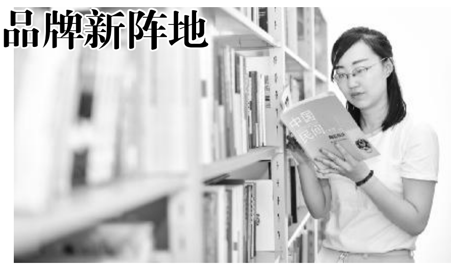
图:职工在书屋阅读书籍,营造浓厚的学习氛围。

据了解,该矿依托职工书屋开展形式多样的读书学习活动,激发职工创新活力,引领职工学习文化知识,增强专业知识和业务技能,争做学习型职工、知识型职工,力争做到学以致用,以良好的精神风貌投入到学习中,为推动矿井安全高效健康发展作贡献。(刘金星)