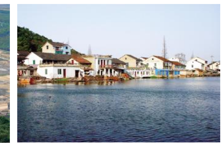
●下孙文化村村西旧貌