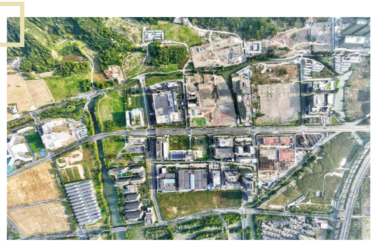
●建设中的中国视谷