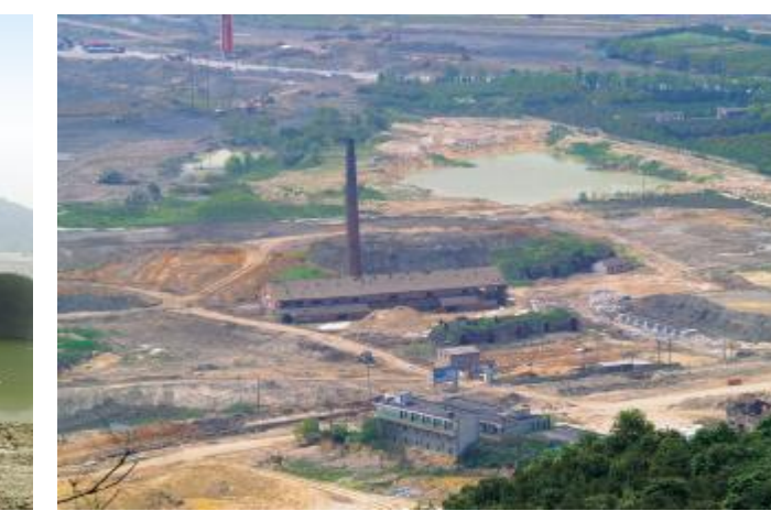
●建设中的眉山岛(2011年)