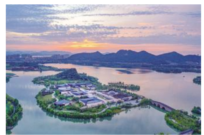
●世界旅游博览馆(2022年)