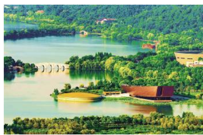
●跨湖桥遗址博物馆(2021年)