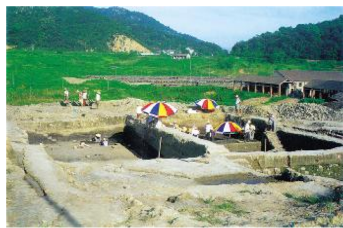
●跨湖桥遗址发掘现场(2001年)