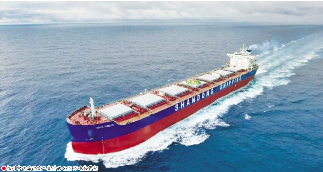
●扬州中远海运重工交付的 8.12 万吨散货船