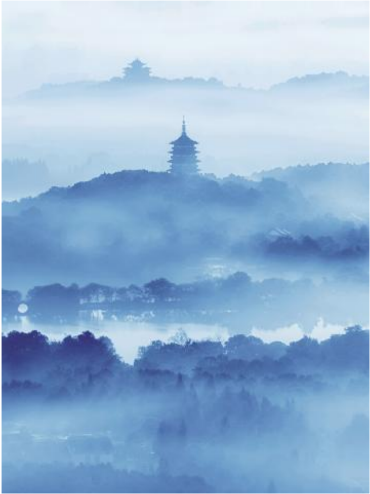
● 西湖云海