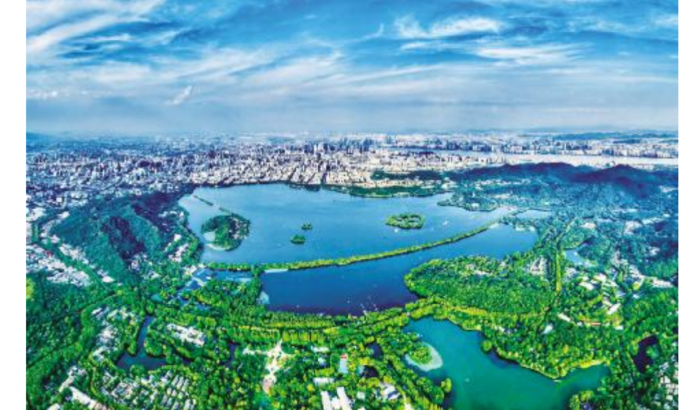
● 西湖鸟瞰

湘湖的将来在哪里? 我们或可以从中找到前行的方向? 浙江新石器时期考古学文化序列以钱塘江为界。江北临绍环太湖流域的考古学序列,从马家浜文化-崧泽文化-良渚文化起始。钱塘江南的考古学序列则由上山文化-跨湖桥文化引领。 跨湖桥文化,中国十大考古发现之一,这是湘