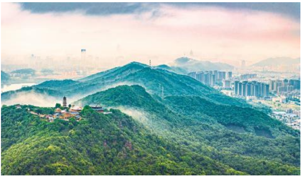
● 湘湖先照禅寺

与许仙的爱情故事。在苏堤,会记起写有“水光潋滟晴方好,山色空蒙雨亦奇。欲把西湖比西子,淡妆浓抹总相宜。”名篇的大文豪苏东坡。