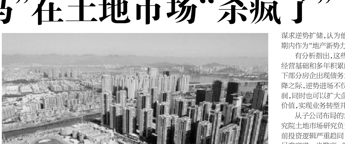
●航拍一处新建住宅

下一，恒源矿“将认真落实主题教育不划阶段、不分环节要求，用心用力、抓细抓实，真正把理论学习、调查研究、推动发展、检视整改贯通起来，有机融合、一体推进，以主题教育扎实推进“五位一体”总体布局标准与实操培训深度融合，做到专业化、实操化相结合，突出抓好员工能力培训和技能培训，开展多训并举，做到学以致用；开展防灾避险和应急技能知识教育，增强员工学习热情，促进和提高员工知识水平，形成人人讲安全、个个会应急“良好环境”。