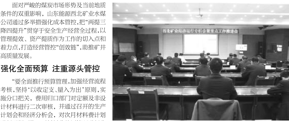
●西北矿业经济运行分析会暨重点工作推进会水煤公司分会场

方做警示标识，抽派人员入小区向职工家属宣传防火、防电、防汛等安全常识，使安全知识得以普及，增强职工家属的安全意识，达到人人要安全的目的。