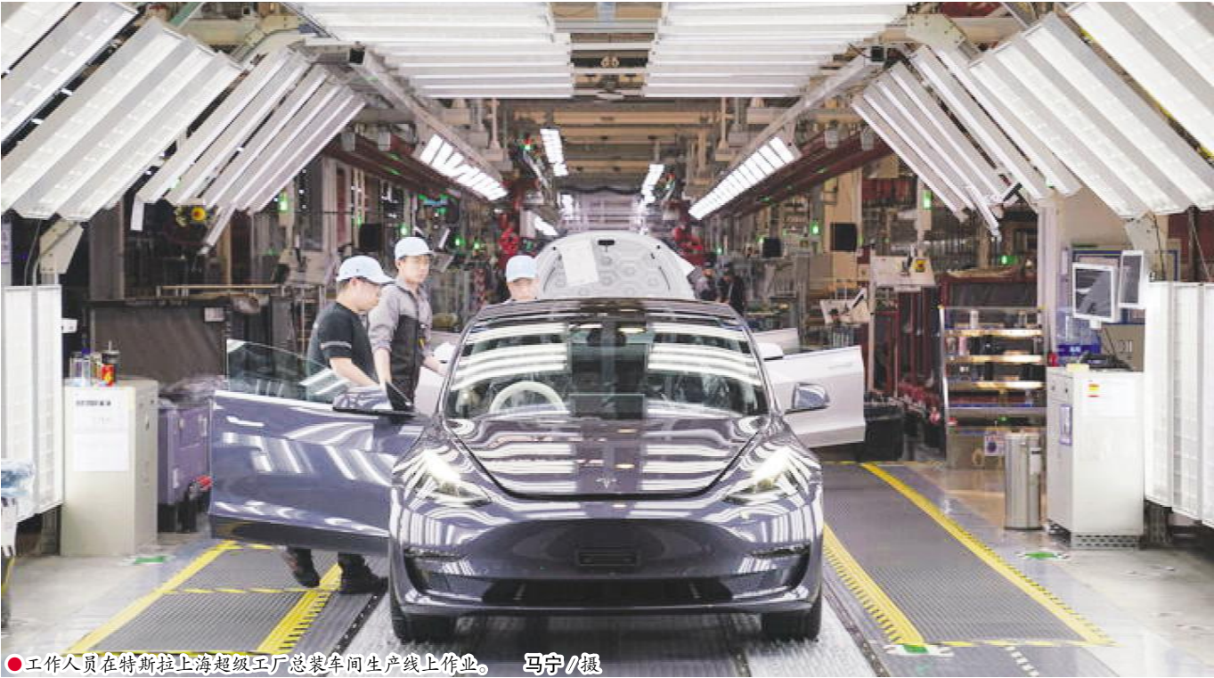
●工作人员在特斯拉上海超级工厂总装车间生产线上作业。