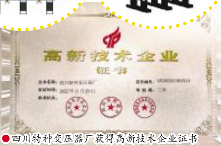
●四川特种变压器厂获得高新技术企业证书