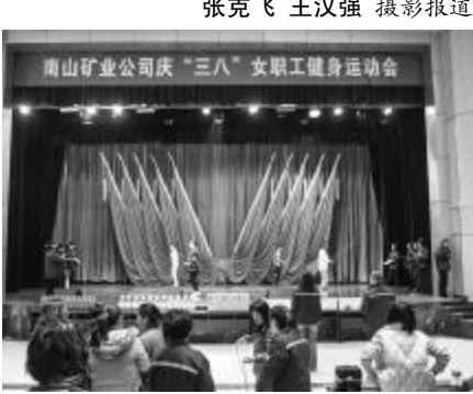
南山矿女职工在趣味运动会上参加跳绳活动。