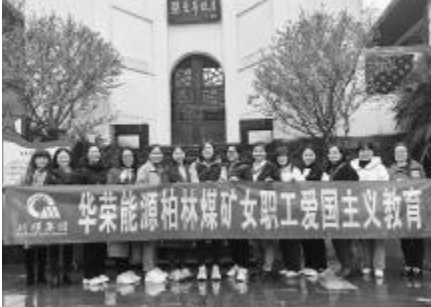
女职工在爱国主义教育基地参观学习。