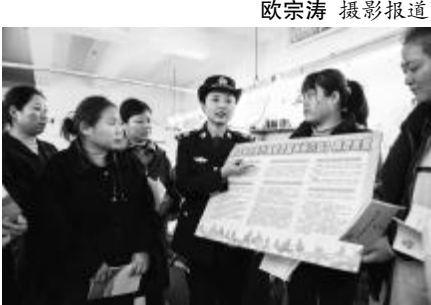
司法局工作人员向女职工宣讲法律知识。

在“三八”妇女节来临之际,为切实维护广大妇女自身合法权益,安徽省含山县司法局开展“建设平安家庭 促进和谐稳定”为主题的妇女维权活动,组织普法工作者入乡村、到集市、进企业,通过发放宣传资料、提供法律咨询等方式,向女职工宣讲《妇女权益保护法》和《反家庭暴力法》等法律法规,帮助她们维护自己的合法权益。图为3月5日,含山县司法局普法工作者走进企业女职工宣讲有关法律和维权知识。