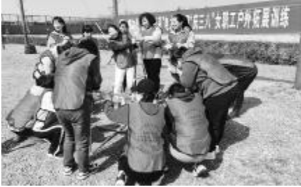
女职工在拓展训练中参与团队协作游戏。

此次的拓展训练活动,充分展现了女职工们积极向上、敢于拼搏的精神风貌,培养了女职工的团队精神和协作意识,增强了分公司女职工队伍的凝聚力。今后,分公司女工将以更加饱满的热情、更积极的心态投入工作中去,做好家庭室内岗,争当单位好职工,充分发挥女职工在企业干事创业中的“半边天”作用,为企业的发展贡献“她”力量。