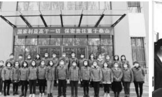
北重集团档案室成员合影