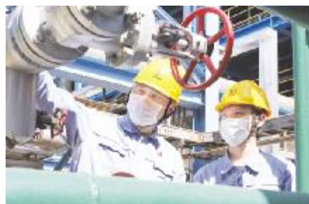
●扬子石化青年员工在现场学习工艺流程。

扬子石化始终坚持科技是第一生产力、人才是第一资源、创新是第一动力，高度重视青年人才引进和培养工作。至2022年，公司35岁以下青年中博士、硕士学历人数为477人，占比为22.03%。未来，公司将进一步培养更多高素质、专业化的复合型人才，为公司高质量发展赋能赋力。（达军 沈建兵）