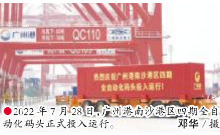
2022 年 7 月 28 日,广州港南沙港区四期全自动化码头正式投入运行。