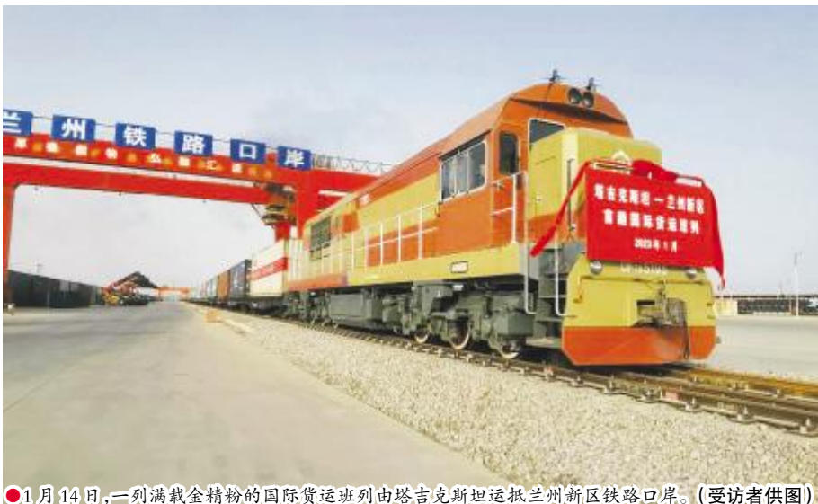
1月14日,一列满载金精粉的国际货运班列由塔吉克斯坦运抵兰州新区铁路口岸。