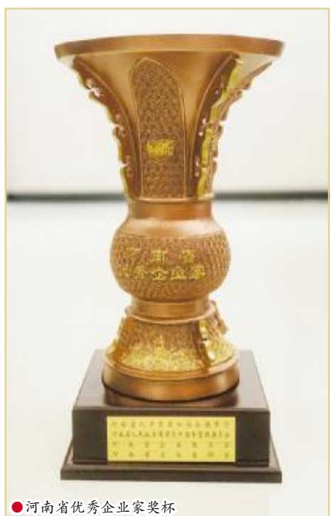
河南省优秀企业家奖杯