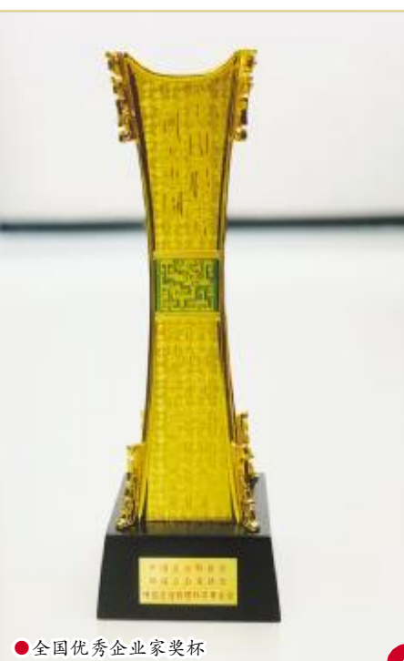
全国优秀企业家奖杯