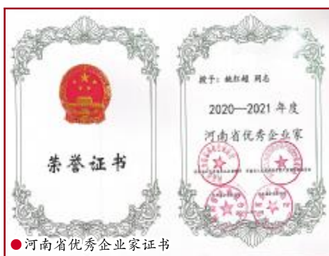
河南省优秀企业家证书