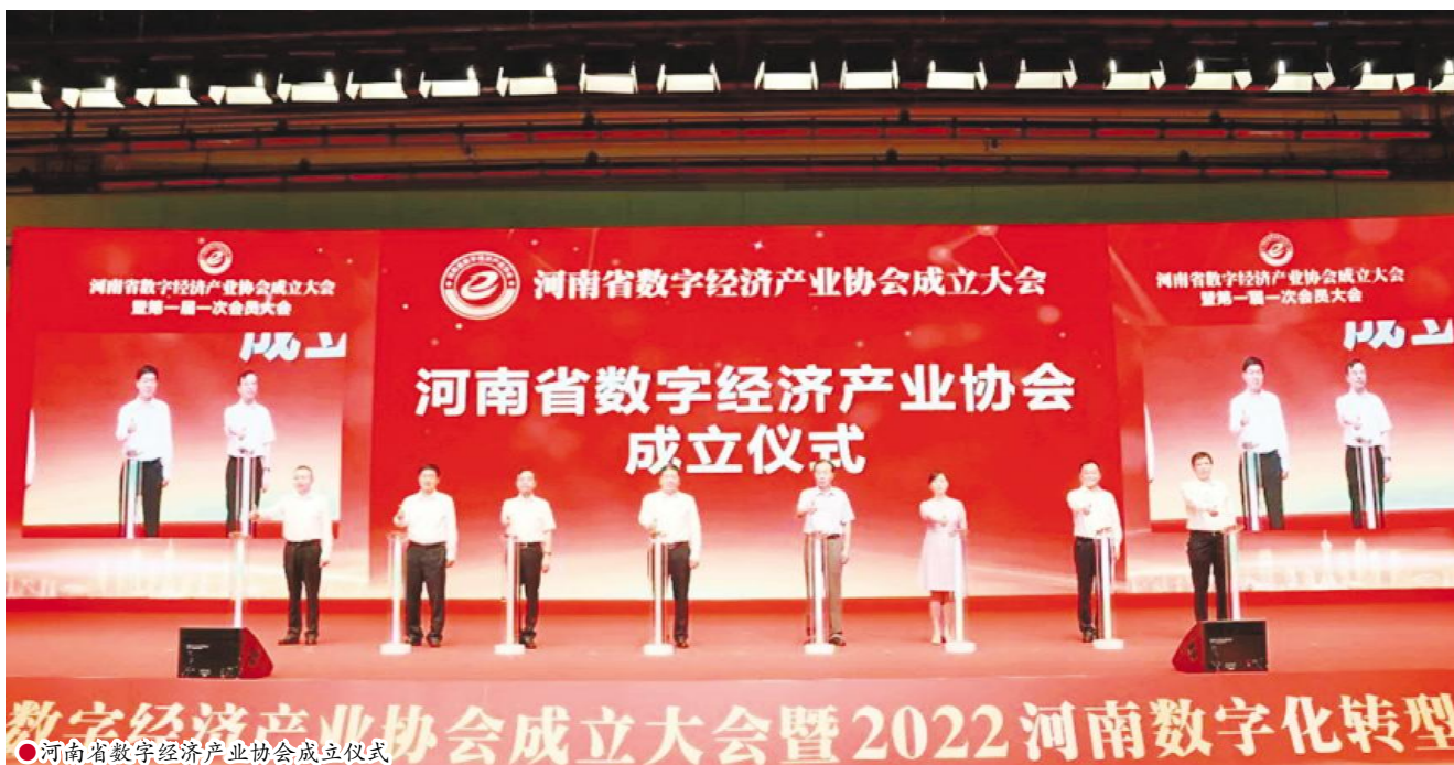
河南省数字经济产业协会成立大会暨2022河南数字化转型大会