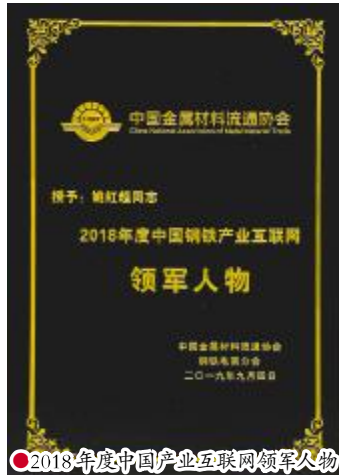
2018年度中国产业互联网领军人物