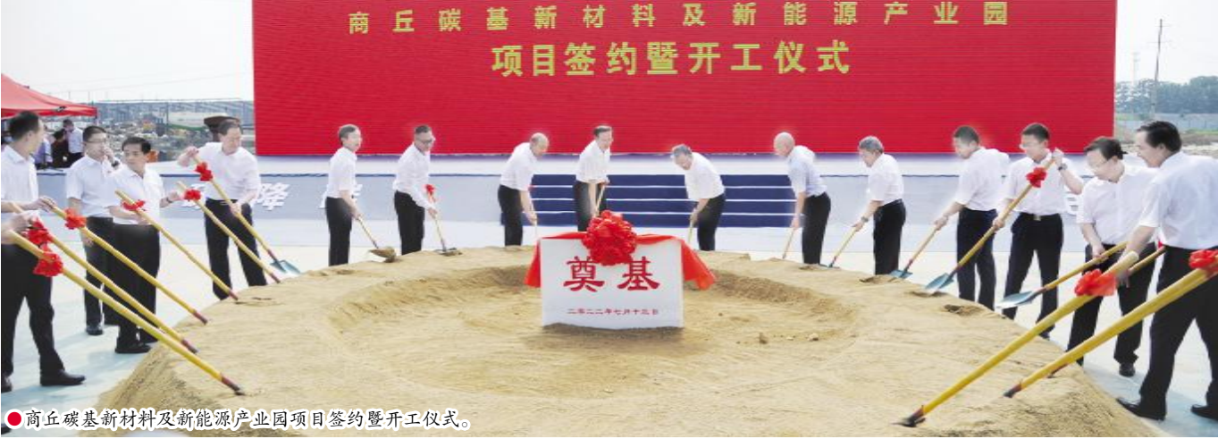
●商丘碳基新材料及新能源产业园项目签约暨开工仪式。