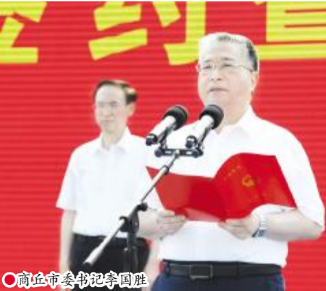
●商丘市委书记李国胜