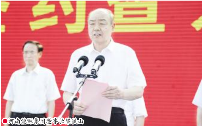
●河南能源集团董事长梁铁山