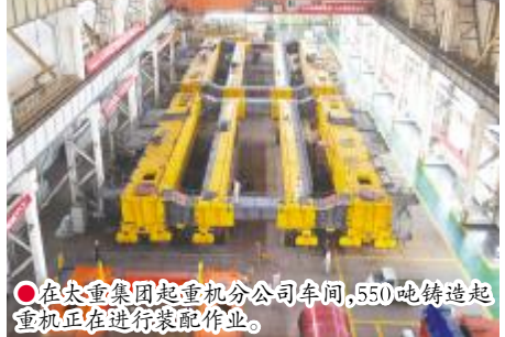
●在太重集团起重分公司车间,550吨铸造起重机正在进行装配作业。

型挖掘机制造商之一,凭借设备耐用、出力大的特点,近两年国内市场占有率几乎100%。